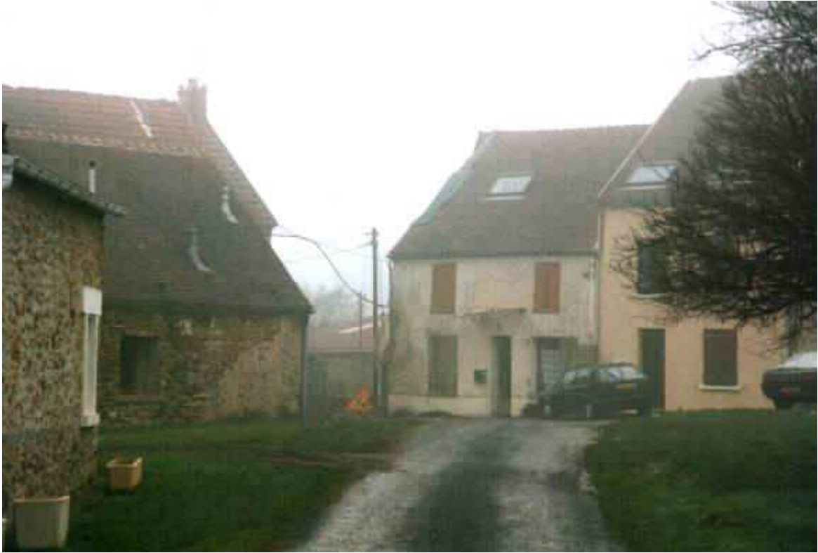
Les villages sont en travaux.