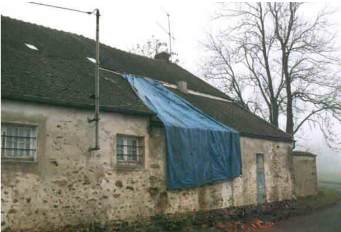
Les maisons sont défigurées.