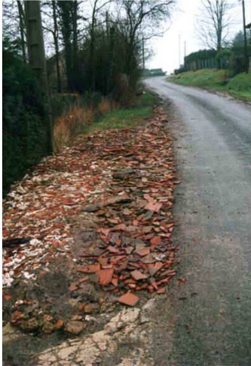
Les bordures de route sont devenues rouges,