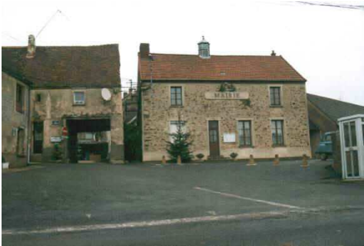
A la Mairie, on préparait l'an 2000