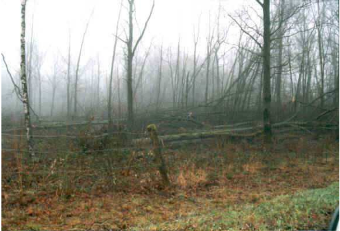
Des clairières se sont formées dans les bois.