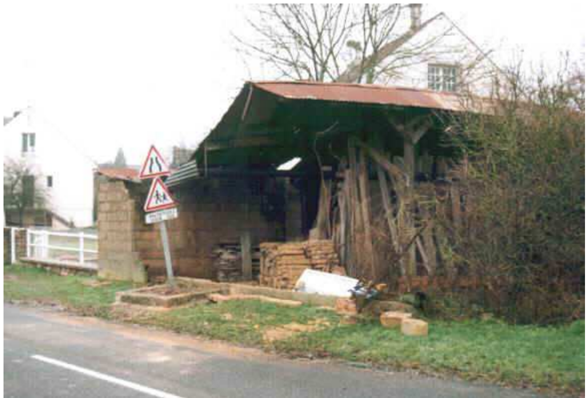
Les briques empilées sont celles du mur qui existait.