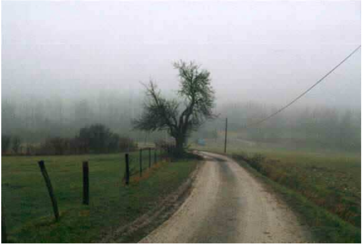
La route de Mautfaucon est boueuse,