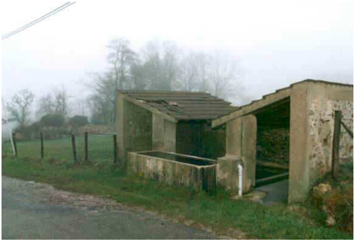
Même notre beau lavoir a été touché...