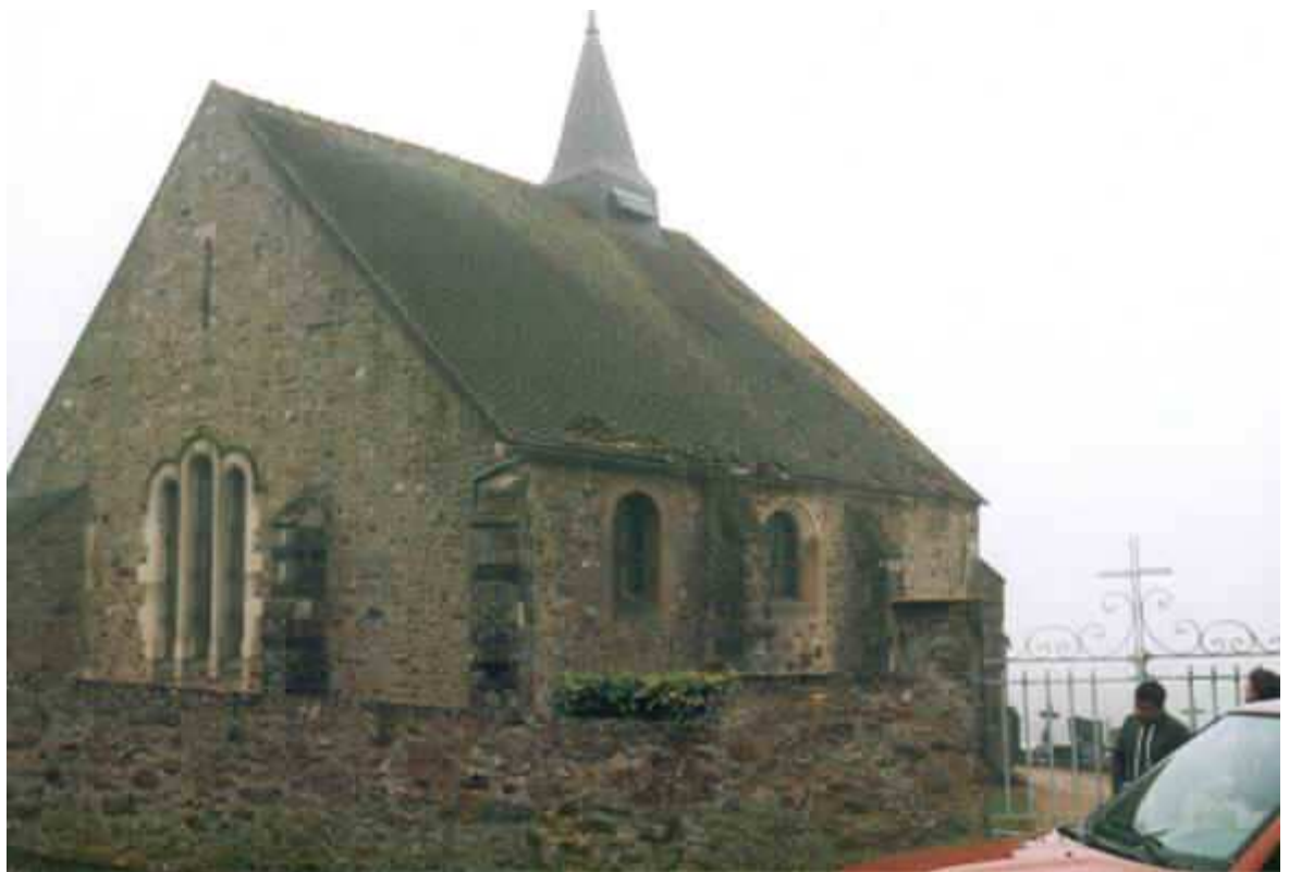
et son église n'a pas résisté.