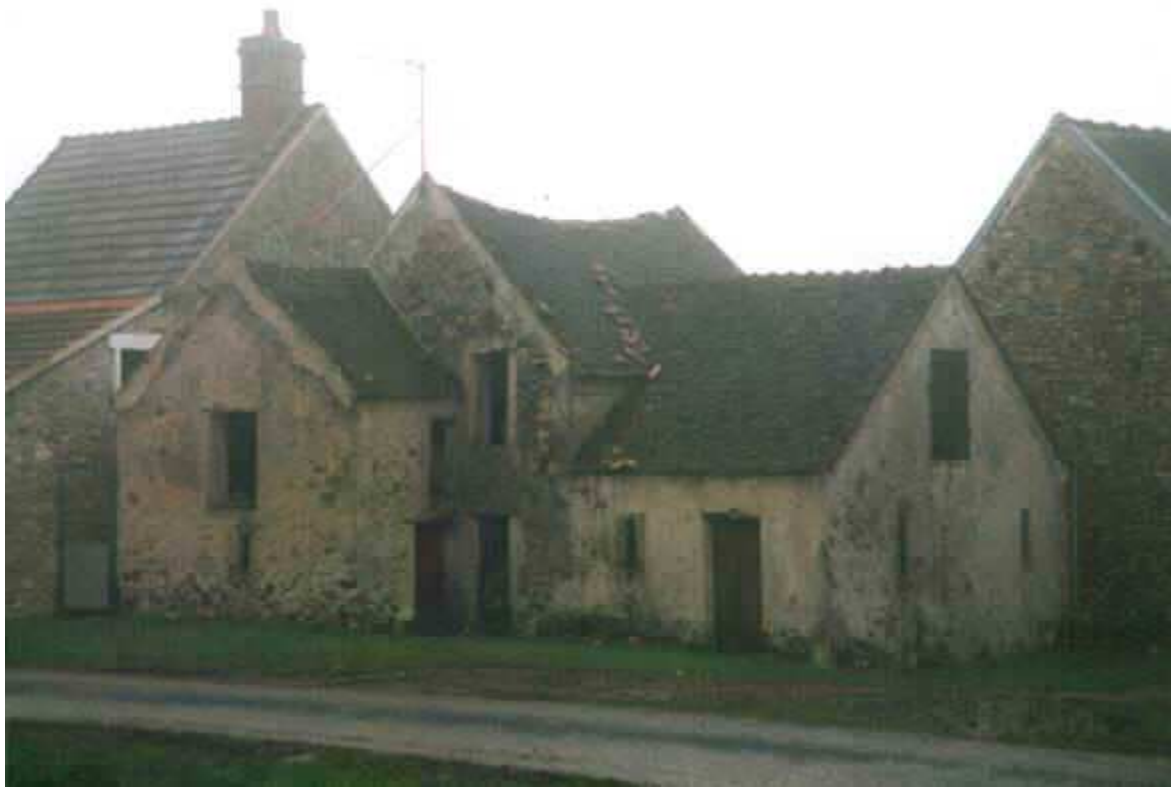
les tuiles arrachées,