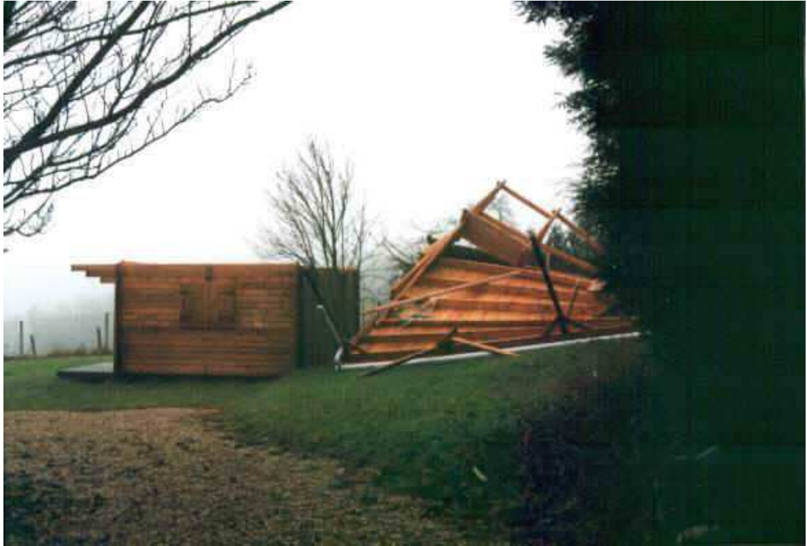
et un chalet s'est ouvert sur le ciel.