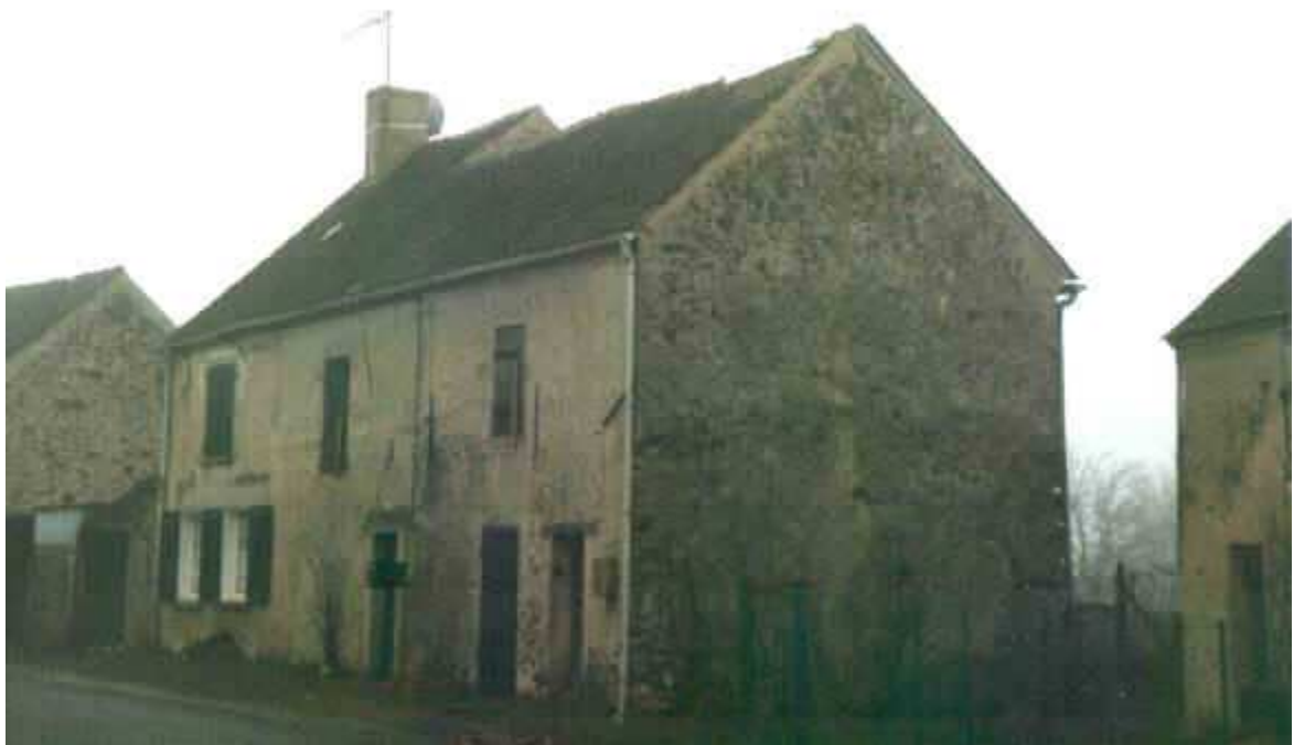
des toitures sont crevées.