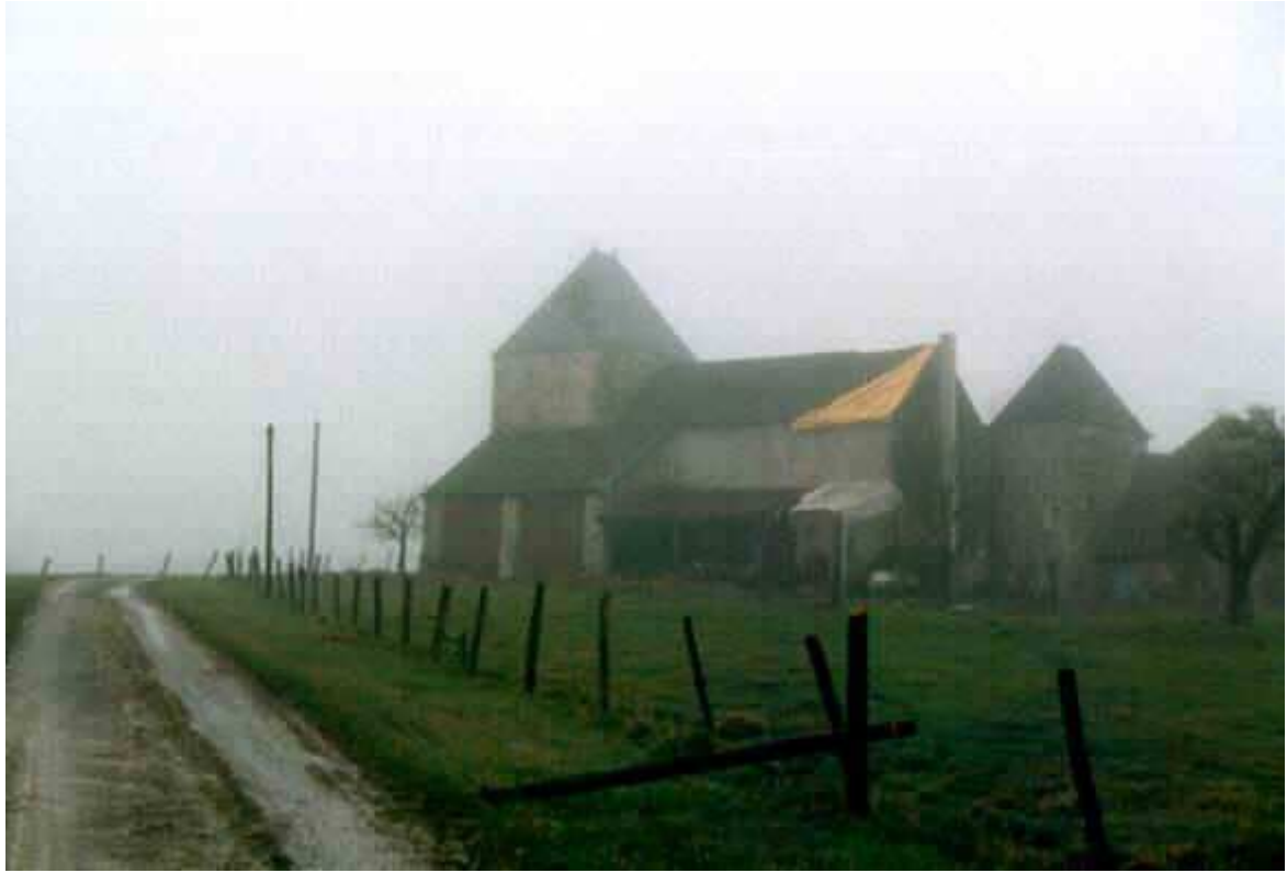
La ferme auberge est bâchée, tout y a été ravagé.