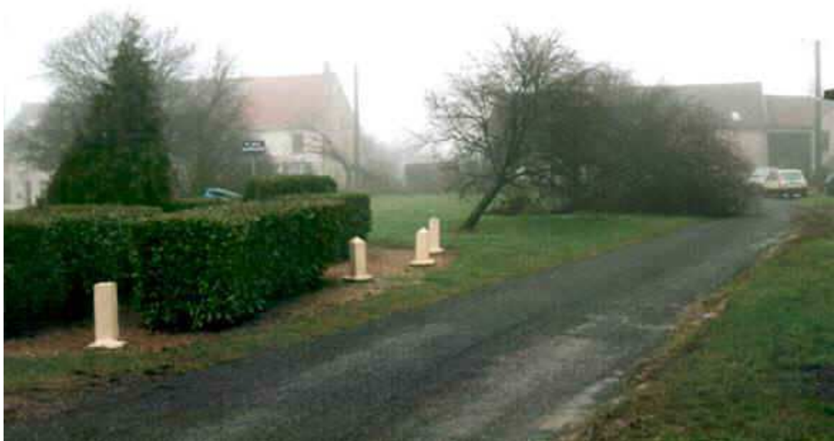
Sur la place des Caquerêts, tous les arbres sont par terre,