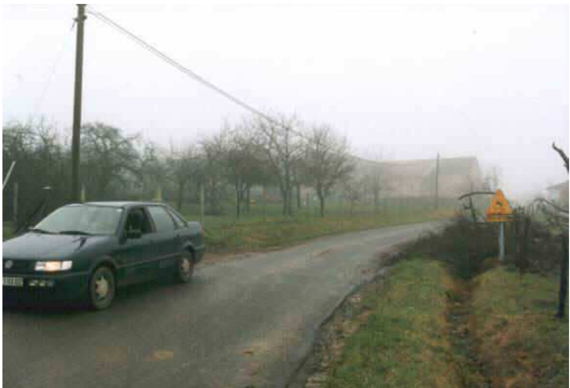
Les routes sont devenues méconnaissables.